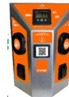
Borne ZE WATT